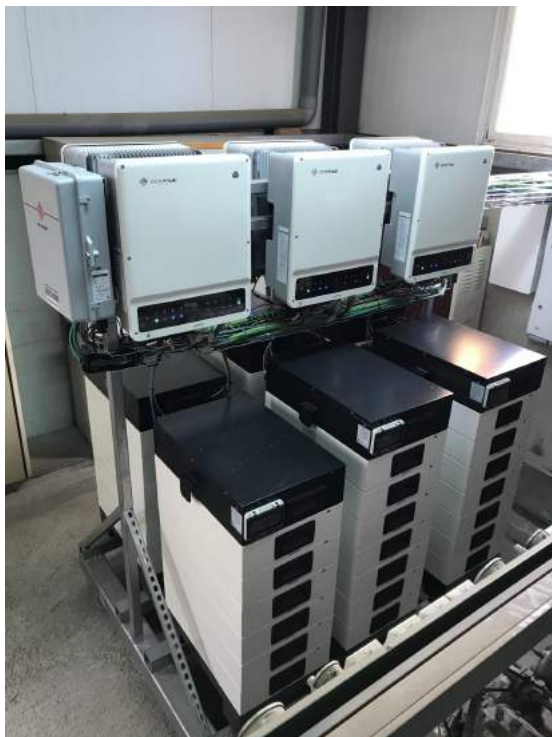
写真1：スペイン、80kWソーラー貯蔵システム、GoodWe ETシリーズ

当社のバックアップ機能は、極端な気候でも24時間の安定供給を実現できるため、グリッドが安定していない国において、ハイブリッドシステムは自給自足の代替案になります。