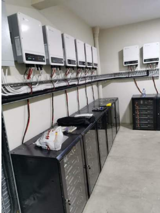
写真2：ガーナ、100kWソーラー貯蔵システム、GoodWe ETシリーズ

当社は2015年から、ドイツ・TÜV Rheinland社の「All Quality Matters」賞を毎年受賞しています。受賞した製品は2015年単相のESシリーズ、2017年SBPシリーズ、及び2018年の三相のETシリーズ等があり、エネルギー貯蔵分野で当社が全面的に、優れた能力を持っていることを示しています。